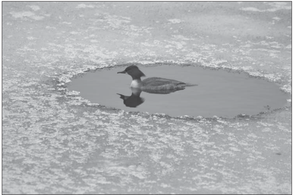
Isokoskelo ei säikäy jättä, kunhan vain sulaakin vettä löytyy.

Pitkän matkan muuttajien vuosikello toimii varsin säännöllisesti, niin että kaikki hyönteisillä elävät laululintulajit, monet petolinnut (esimerkiksi kalasääksi) ja myös eräät lokkilinnut (selkälokki ja kalatiira) suunnistavat alkusyksystä etelään odottelematta tietoja talven laadusta. Silti kaikissa lajeissa on aina yksilöitä, jotka eivät lähde muutolle. Niiden mahdollisuudet selvitä lauhastakin talvesta ovat vähäiset, mutta lämpimillä keleillä näitä viivyttelijöitä voi löytyä hyvinkin myöhään. Tänä talvena talvehtimaan jääneitä lintuja on poikkeuksellisen paljon, arviolta satakunta lajia kun normaali talvikanta on noin 70 lajia. Vuodenvaihteen erikoisuuksia olivat Helsingin seudulla havaitut kirjosieppo, tiltalti, mustaleppälintu ja niittykirvinen. Tammikuun lopulla Ahvenanmaalla liikkui kevättä etsiskelevä kiuruparvi. Keski-Suomessa havaittuja talviharvinaisuuksia ovat edustaneet rautiainen, harmaahaikara, turkinkyhky, vuorihemppo ja lehtokurppa