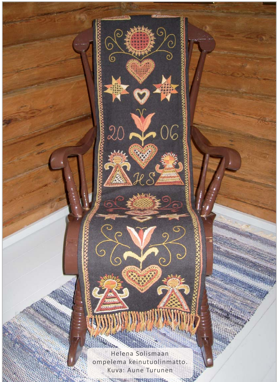
Helena Solismaan ompelema keinutuolinmatto.